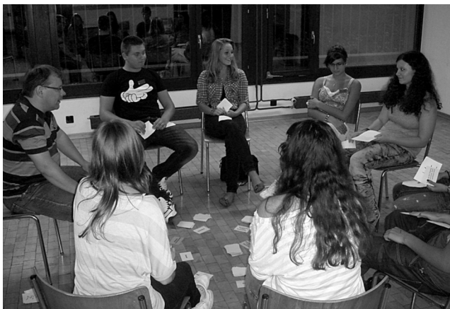
Jugendbegleitung an der Schnittstelle Schulabgang und Berufswahl

Neben der Durchführung von einzelnen Modulen fiel der Juseso die Aufgabe der Koordination und Administration zu.