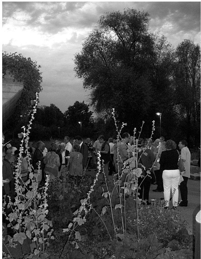
Spätsommerflor der Grün 80 – eine exquisite Kulisse für die Gäste

- doch auch subtil und nie verletzend - machten sie in ihrem bereits 8. Programm Gebrauch vom «Recht - ja bisweilen der Pflicht der Gläubigen», ihre Meinung kundzutun.