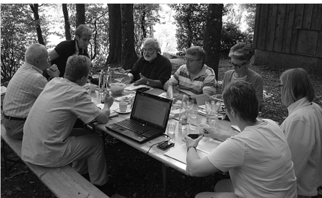
Klausurtagung des Landeskirchenrats mitten in der Natur

Nach der Totalrevision der Anstellungs- und Besoldungsordnung (ABO), welche im 2010 vorgenommen wurde, war im Berichtsjahr die Teilrevision der Landeskirchenverfassung die nächste Gesetzesreform, die in kurzen Abständen durchgeführt wurde. Dabei hat auch die Synode bei den komplexen Beratungen einen sehr