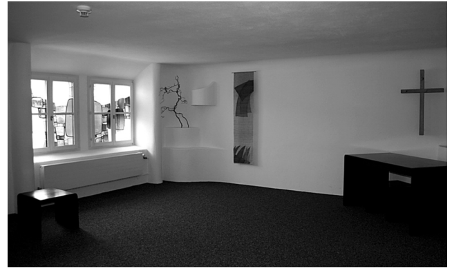
Schlicht und einladend: Der Besinnungsraum im JBZ Seewen