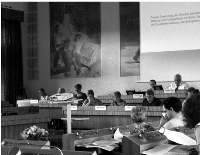
Frühjahrs-Synode 2011 im Landratsaal in Liestal