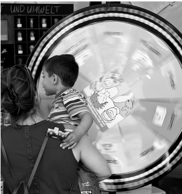
Anziehungskraft mit Gewinnchancen für Gross und Klein: Glücksrad

2011 bescherte dem Familienpass gleich drei öffentliche Auftritte. Beim Tinguely-Brunnen (7. Mai) sowie im Merian Park Brüglingen (20. August) lockte das FP-Glücksrad und Familienportraits viele Besucher an – beide Anlässe waren den Feierlichkeiten zum 125-jährigen Jubiläum der CMS gedankt. An der Basler Sportnacht (27. August) machten viele Familien von dem Angebot gebrauch, direkt auf der Kaserne einen Famili-