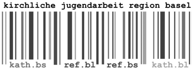
«Strichcode» als Logo und Markenzeichen

Die Zusammenarbeit ist ein «Markenzeichen» der vier Kirchen; das Logo mit dem Namen «Strichcode» bringt dies zum Ausdruck.