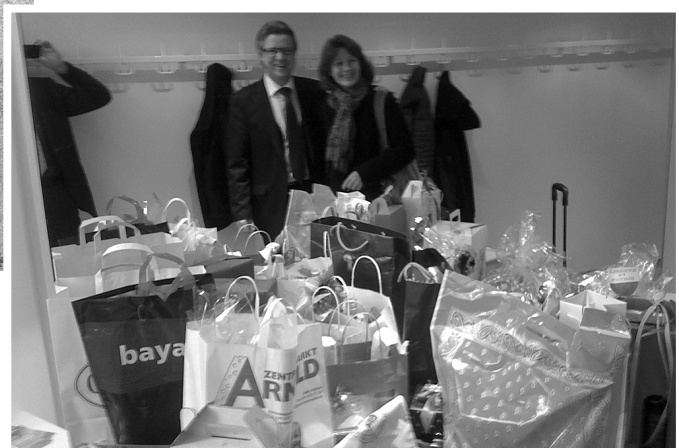
Der Gabentempel der Mitgliedskantone