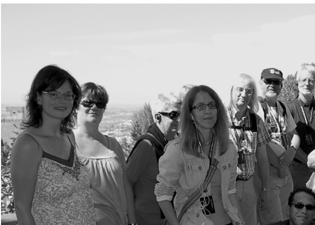
Die Dekanatsgruppe geniesst bei sonnigem Wetter die Studienreise in Andalusien