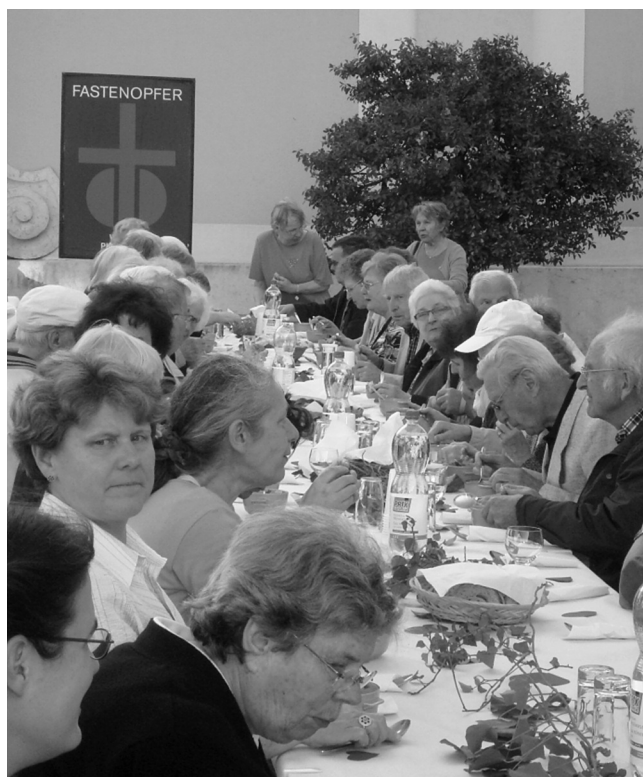
Abschluss: Gemeinsam am Tisch der Versöhnung

Der Versöhnungstag schloss mit einem Suppenessen nach dem Gottesdienst auf dem Domplatz.