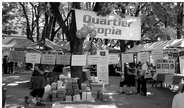
Das Quartier Utopia am Tag der Kirchen am Rheinknie

Das soziale Engagement der Kirchen wurde auch am 29. Mai, dem Tag der Kirchen am Rheinknie, sichtbar. Die Fachstelle lud die sozialen Institutionen ein, im Rahmen von Utopia, einem Zukunftslabor für nachhaltige Stadtentwicklung, ihre unterschiedlichen Initiativen vorzustellen. Neben Caritas und Diakonie aus allen drei Ländern stellten sich 15 weitere kirchennahe Organisationen vor, darunter Wegbegleitung Arlesheim, Basel, Laufental und Leimental, welche an einem gemeinsamen Stand ihr Angebot für alle Sinne erlebbar vorstellten.