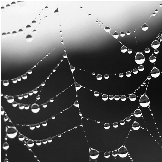
Netzwerke verbinden und halten