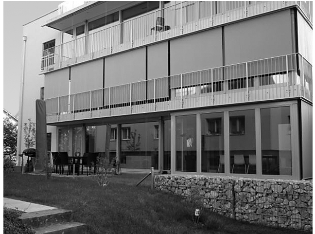
Beliebt und gut vermietet: Neubau Mehrfamilienhäuser Hegenheimermattweg in Allschwil

Diese Liegenschaft ist gesamthaft betrachtet in einem äusserst renovationsbedürftigen Zustand. Die dringendsten sicherheitsrelevanten baulichen Mängel wer-