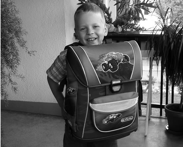
Gut ausgerüstet für den grossen Anfang

In Zusammenarbeit mit der Winterhilfe BS und BL erhielten angehende Primarschüler/innen mit FamilienpassPlus ein komplettes Schulsack-Set nach Wahl zu einem symbolischen Selbstkostenbeitrag von CHF 20.–.