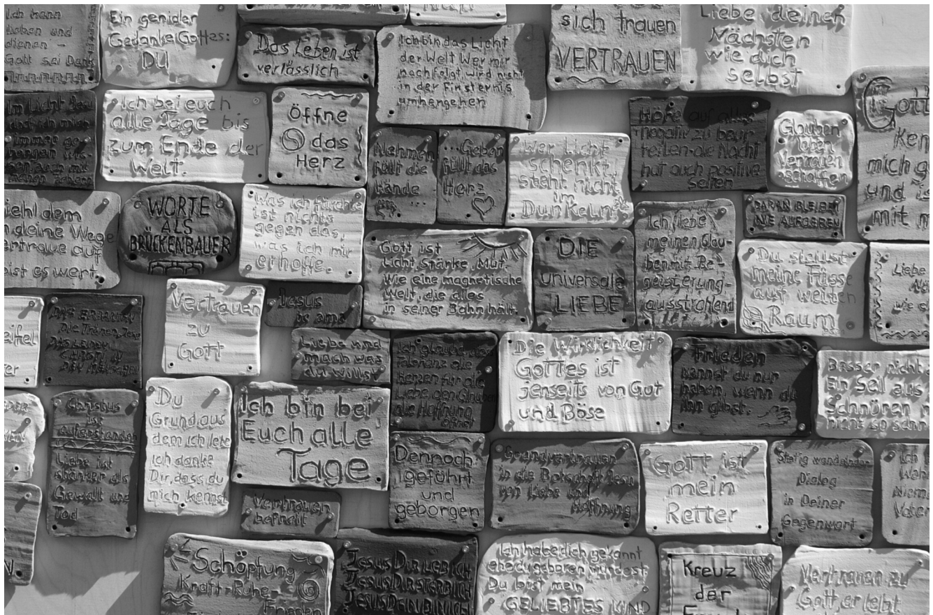
Kirche ist GlaubensGemeinschaft. Eine Sammlung von persönlichen Kernaussagen zum eigenen Glauben, in Ton gebrannt: Mitteilen und teilen, was trägt und Mauern durchbricht. (Kirchhof Pfarrei Bruder Klaus, Liestal)