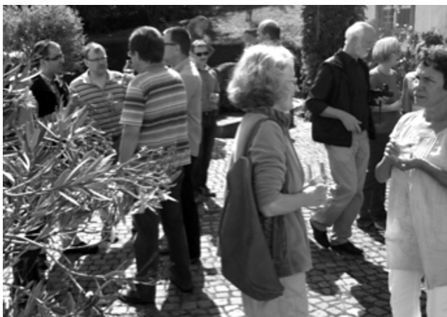
Die Diskussionen in Wislikofen gehen beim Apéro weiter: Mitglieder des Dekanats Liestal.