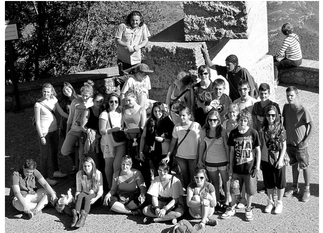
Jugendreise nach Montserrat/Barcelona

Konkret wurden 2011 Dienstleistungen und personelle Unterstützungen z.B. für folgende Pfarreien übernommen: