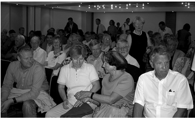
Die Gästeschar in froher Erwartung des Programms

Mit der Deklaration des Europarates, das Jahr 2011 zum «Europäischen Jahr der freiwilligen Tätigkeit» zu erheben, sollte die gesellschaftliche Bedeutung dieser Tätigkeit sichtbar gemacht werden und die Anerkennung dieses grossen Engagements optimiert werden. Die Freiwilligenarbeit wird allzu oft als «selbstverständlich» betrachtet, oder man hat sich schlicht daran gewöhnt, dass alles ja ohnehin irgendwie funktioniert und «es schon jemand macht». Nur die Menschen hinter diesem «Funktionieren» werden viel zu selten in den Focus gestellt. Das wollte das Freiwilligenjahr 2011 ändern. Deshalb hat auch die Landeskirche mit einer Einladung zu einem Anlass in die Grün 80 den vielen Freiwilligen, die für die Kirche in unserem Kanton tätig sind, danken wollen. Die Eingeladenen, die eine Funktion in der Landeskirche oder in den Kirchgemeinden ausüben, kamen zahlreich und genossen einen spannenden Abend.