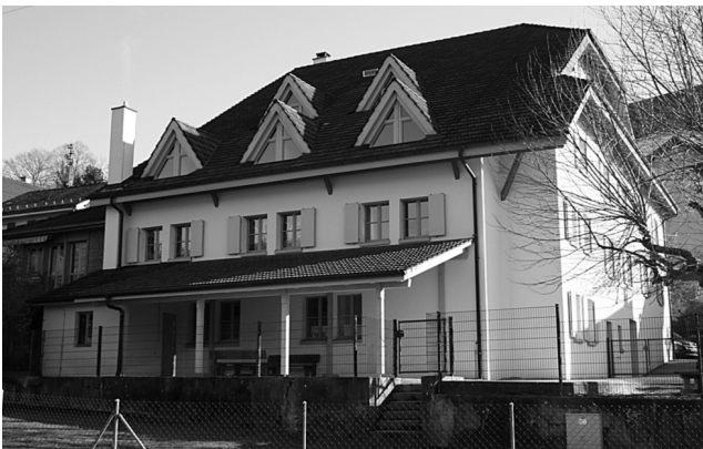
Das JBZ Seewen nach der Renovation: Modern und funktionell

Im Juni 2011 hat die Synode weitere Mittel für notwendige Sanierungsarbeiten im JBZ bewilligt. Mit Rücksicht auf die Vermietung konnte im September mit den Arbeiten begonnen werden. Im Aussenbereich wurden die untere Spielwiese und die Umgebung so instand gestellt, dass die jährlich anfallenden Kosten für den Gartenunterhalt deutlich reduziert werden können. Der gesamte baufällige Gartenzaun wurde durch einen neuen stabileren Zaun ersetzt und mit einem grossen abschliessbaren Gartentor ergänzt, so dass der Aussenbereich nicht mehr frei und öffentlich zugänglich ist, was in jüngster Zeit immer wieder zu Unstimmigkeiten führte.