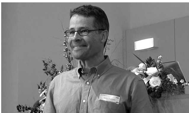
Der Stellenleiter an der Europäischen Freiwilligenuniversität

Kirche in vielfältiger Weise zur Sprache zu bringen. Der Stellenleiter zeichnete an vorderster Front verantwortlich für die Durchführung der sechsten Europäischen Freiwilligenuniversität, welche vom 31. August bis 3. September in Basel stattfand.