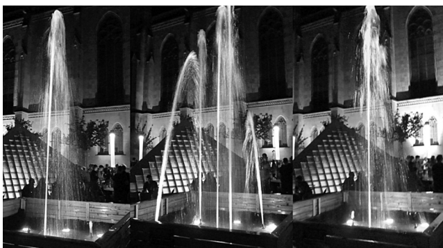
Springbrunnen auf dem Pyramidenplatz: Ein Hingucker

Jugendkulturfestival 2011: die askja war ein Teil der Gesamtleitung «leerer kopf14» - der Pyramidenplatz wurde zur «grünen Lunge» des Festivals, und sorgte dank dem besonderen Engagement der Landeskirche BL mit einem Springbrunnen für den Blickfang des Festivals.